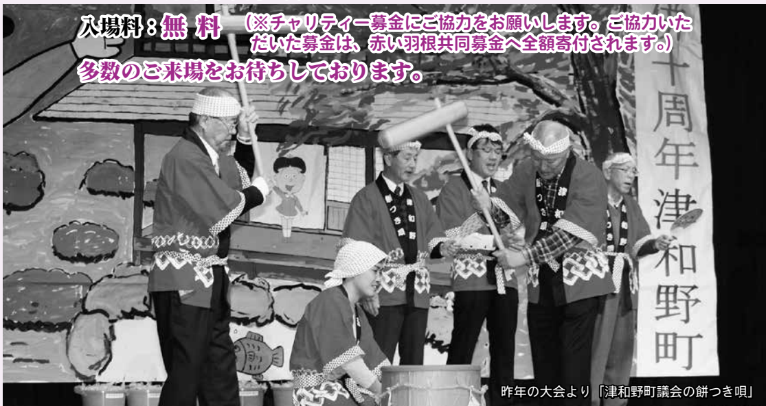
昨年の大会より「津和野町議会の餅つき唄」