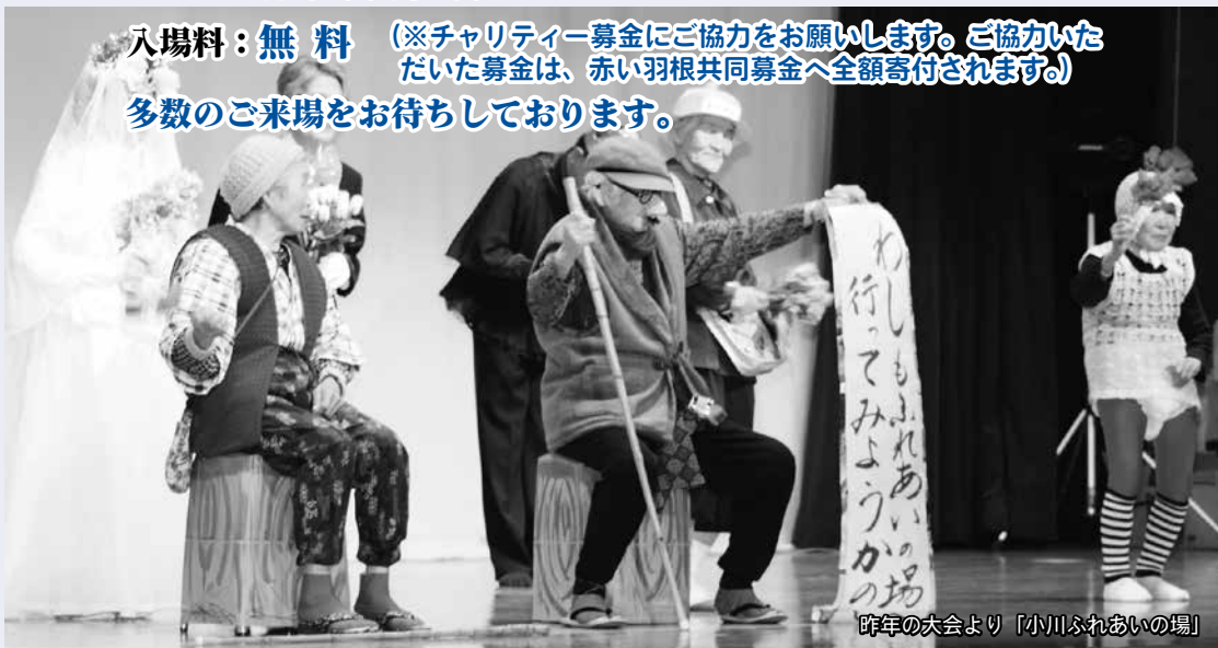
昨年の大会より「小川ふれあいの場」