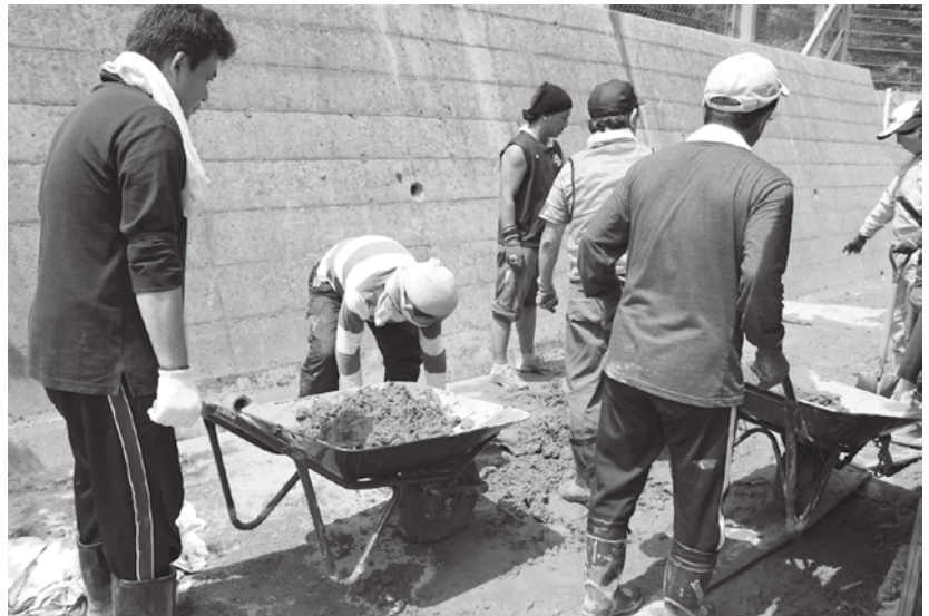
平成25年の津和野町の豪雨水害の際にも活用されました。

日頃から、地域住民を対象とした防災訓練、災害ボランティア研修等も多く実施されており、こうした訓練活動や災害対応拠点整備事業への助成も増えています。復興には長い年月がかかることが予想され、息の長い支援が必要です。寄附者の皆さまからお預かりした貴重な財源とその思いを被災地で活動する団体につなぎ、団体の活動を柔軟に支援することを通じて、被災された方々を支えています。