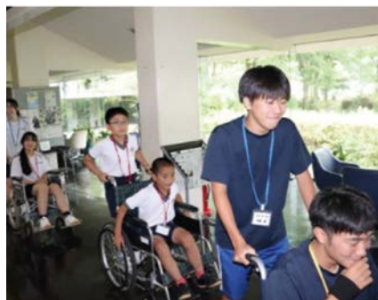
サマーボランティアスクール