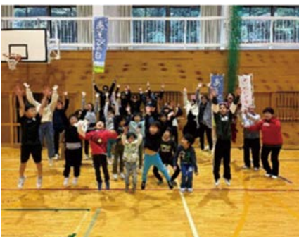
津和野あそびフェスタ2026

集まった募金は、津和野町地域老人クラブ連合会の「ふれあいスポーツ大会」、日原地域老人クラブ連合会の「高齢者スポーツ交流事業」、津和野町スポーツ少年団の「津和野町スポーツ少年団大会等事業」、津和野町レクリエーション協会の「津和野あそびフェスタ 2026 あそびの日」など全18事業に助成されます。